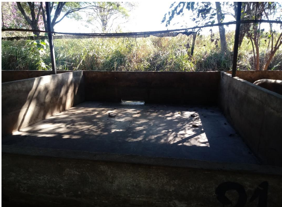
FIGURA 1 – Baia coletiva de piso de concreto e bebedouro tipo chupeta.

O galpão de gestação coletiva é dividido em 54 baias para as fêmeas, uma para o macho e uma para o armazenamento de sacos de ração e utensílios de manejo, totalizando 56 baias. Cada baia possuía 27 m 2 (6 m x 4,50 m) com piso de chão de concreto e dois bebedouros do tipo chupeta. A instalação é estruturada em alvenaria e coberta com telha de fibrocimento ondulada (Figura 1).