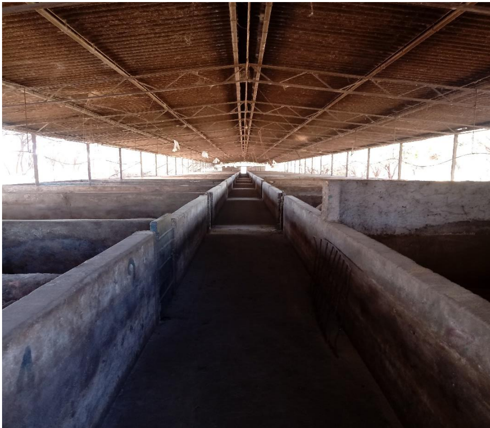
FIGURA 2 – Galpão da fase de gestação, totalizando 56 baias de alojamento coletivo de matrizes suínas gestantes.

As fêmeas observadas foram agrupadas em grupos com média de 35 dias de gestação, de acordo com o preconizado pela Diretiva 2008/120/CE da União Europeia, pela qual os padrões mínimos de criação de suínos. Essa normativa orienta a obrigatoriedade da criação de matrizes suínas gestantes em baias coletivas, no período que compreende as quatro semanas após a inseminação, e os sete dias que antecedem a data prevista para o parto 62 .