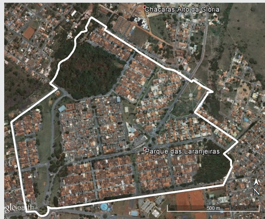
Imagem de Satélite do Parque das Laranjeiras - Fonte: Google Earth, adaptado pela autora