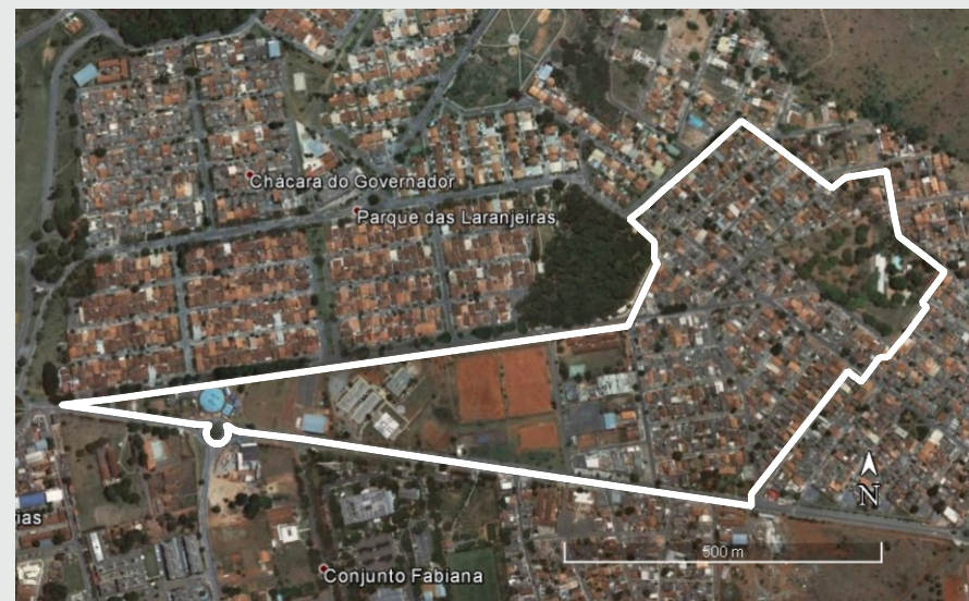
Imagem de Satélite da Chácara do Governador