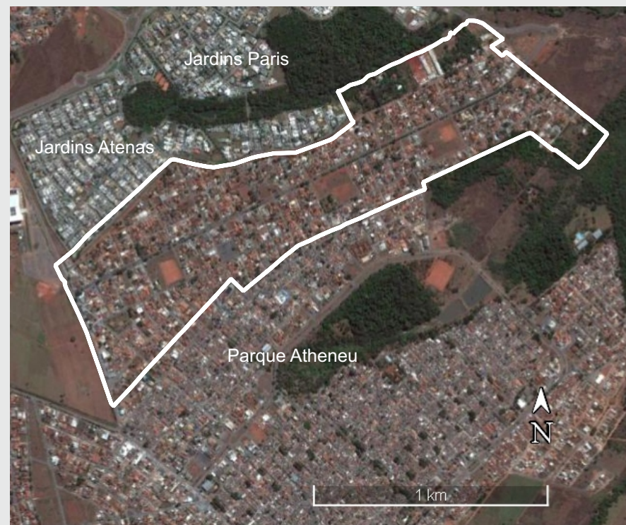
Imagem de Satélite do Jardim Mariliza