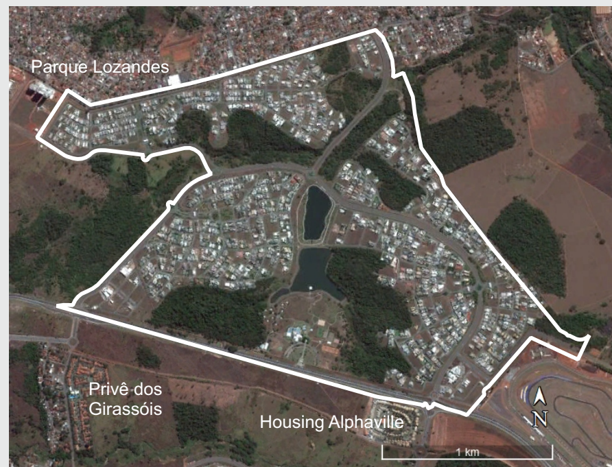
Imagem de Satélite do Alphaville Flamboyant