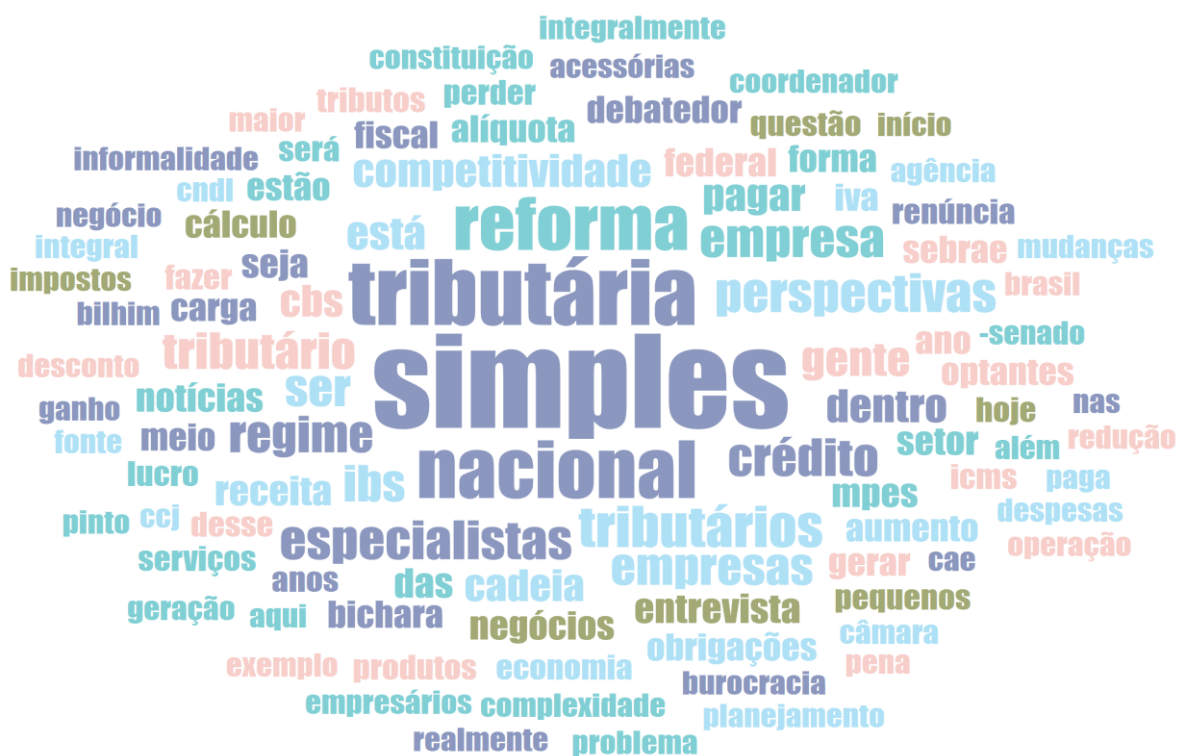
Figura 3 - Nuvem das 100 palavras mais frequentes nas opiniões dos especialistas