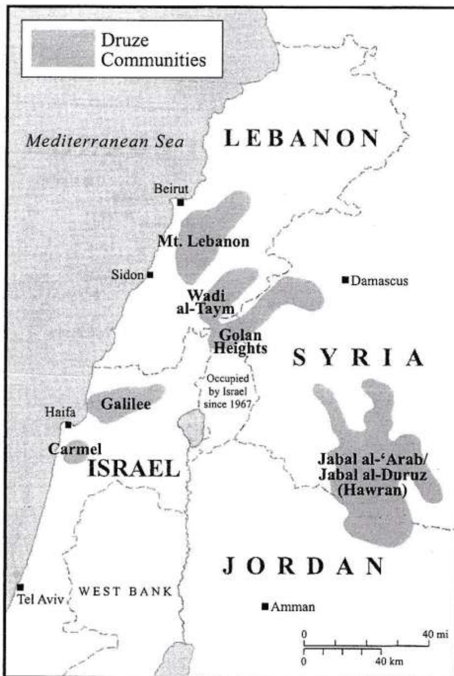
Map 1. Druze Communities in the Middle East