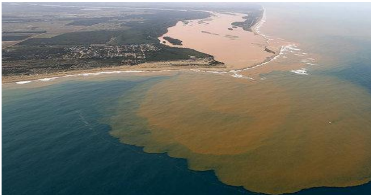
FIG.1 Lama da barragem de Mariana (MG) está no mar do Espírito Santo -.

bilhões de litros de lama com dejetos de mineração. A tragédia de Mariana é considerada a pior tragédia socioambiental do Brasil e do mundo, envolvendo rejeitos de barragem de mineração. 49 Vejamos algumas imagens da tragédia: