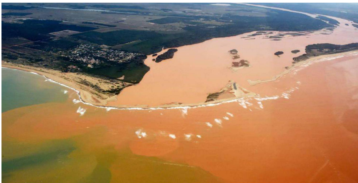
FIG. 2 Tsunami de rejeitos chegou até o litoral do Espírito Santo. Fred Loureiro / Secom (Fotos Públicas) (EL PAÍS, 2016).