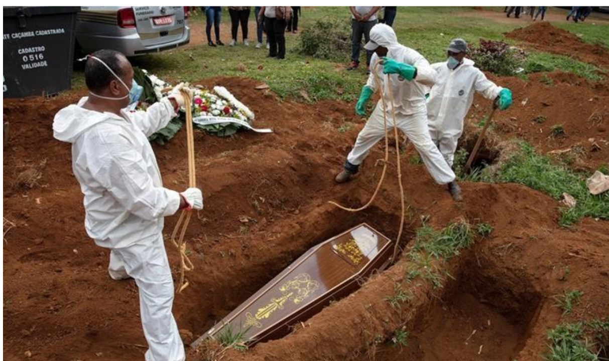
Figura 2: Enterro durante a Pandemia

dos cortejos 7 . No entanto, inúmeras pessoas foram enterradas sem que parentes tivessem tempo de chegar de outras cidades e países e, em muitos casos, mesmo morando na mesma cidade, amigos e parentes próximos não puderam visitar seus entes queridos. Abaixo, a figura 2 mostra uma cena de enterro durante a pandemia, em que é possível perceber a presença da equipe vestida com equipamentos de proteção individual (EPI), como máscaras, luvas, macacão e bota. Atrás, é possível notar poucos participantes, que observam de longe o processo de cortejo para depósito direto nas gavetas sepulcrais, sem cerimônia prévia.