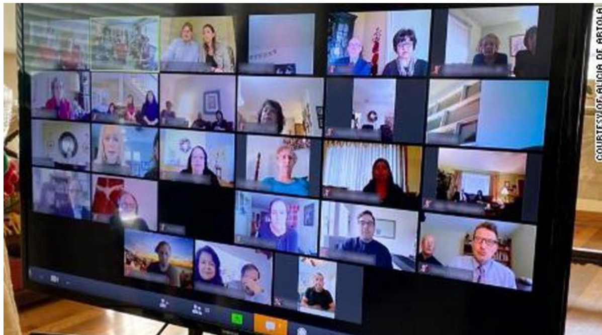
Figura 4: Velório online