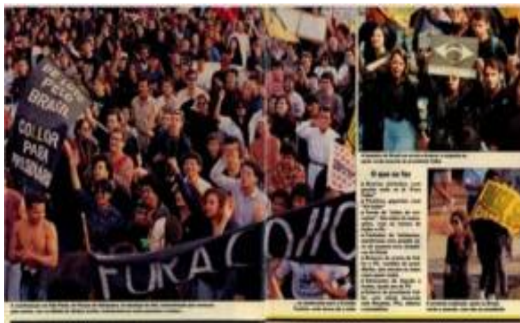
Imagem 29: Matéria de página - O Brasil renuncia a Collor

Fonte Revista Veja , São Paulo, nº 1249, 26/08/1992, p. 32 - 33.