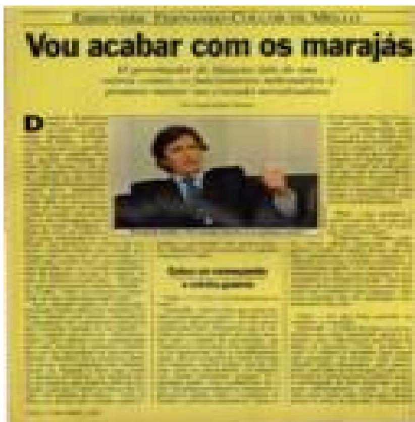
Imagem 2: Entrevista de Collor às páginas amarelas