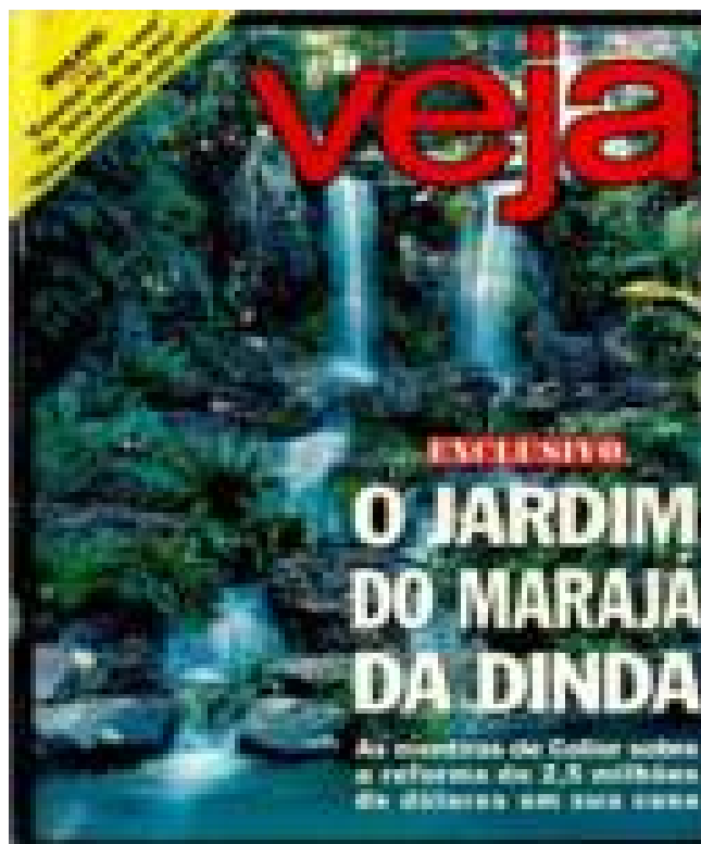
Fonte: Revista Veja , São Paulo: Editora Abril, nº 1251, 09/09/ 1992.

A revista não somente acompanhou, paulatinamente, o desdobramento dos fatos, mas também julgou, condenou e, em alguns casos, as matérias veiculadas insinuavam o desfecho