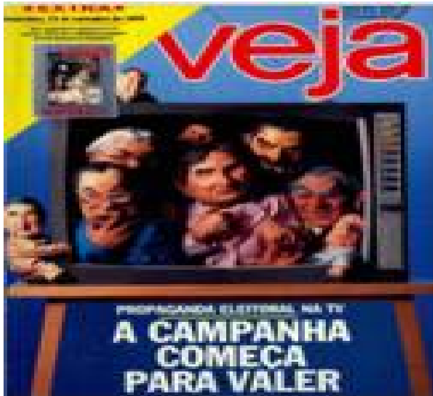
Imagem 5: Capa da Veja - Propaganda eleitoral na TV