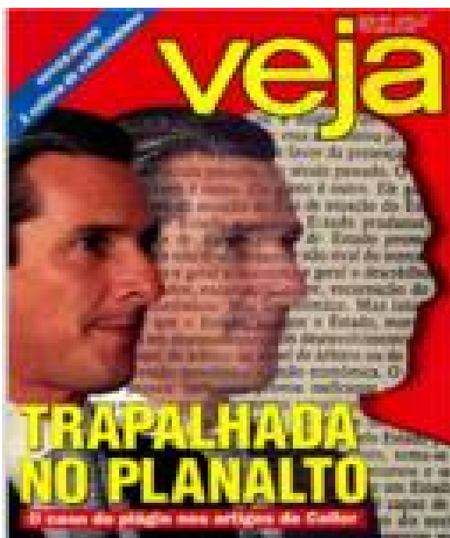
Imagem 10: Capa da Veja - Trapalhada no Planalto