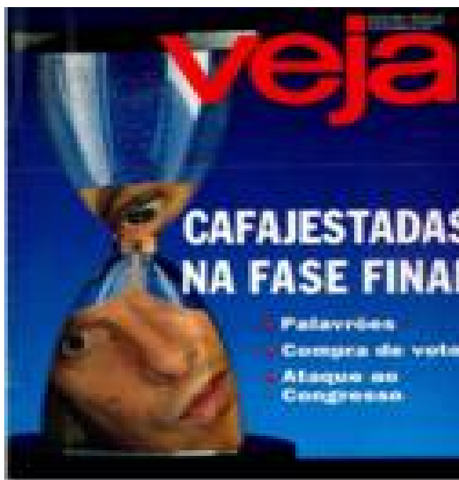
Imagem 14: Capa da Veja - Cafajestadas na fase final