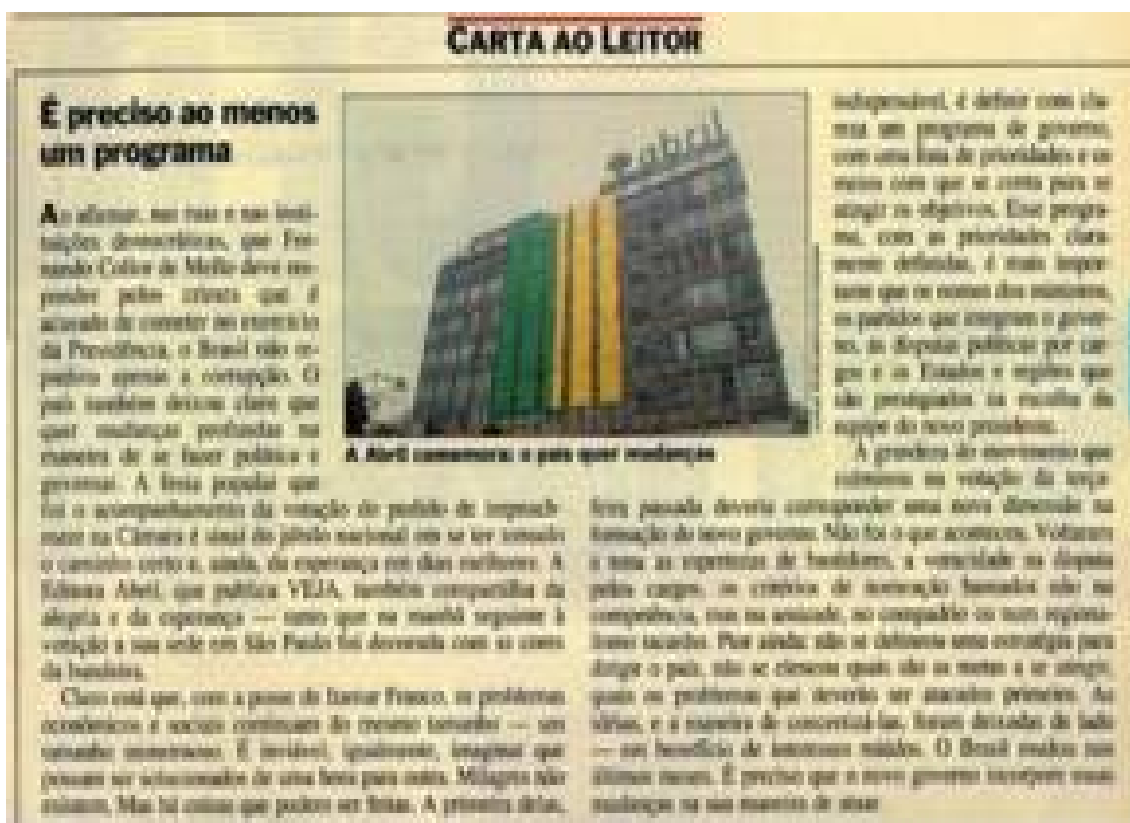
Imagem 20: Editorial - É preciso ao menos um programa