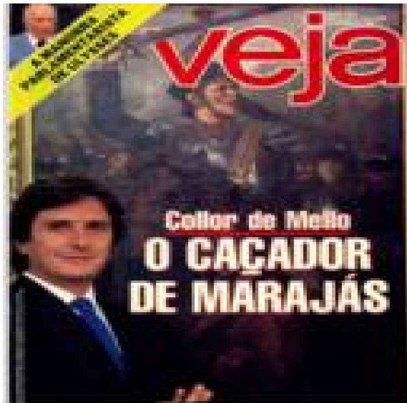
Imagem 1: Capa da Veja - O caçador de marajás