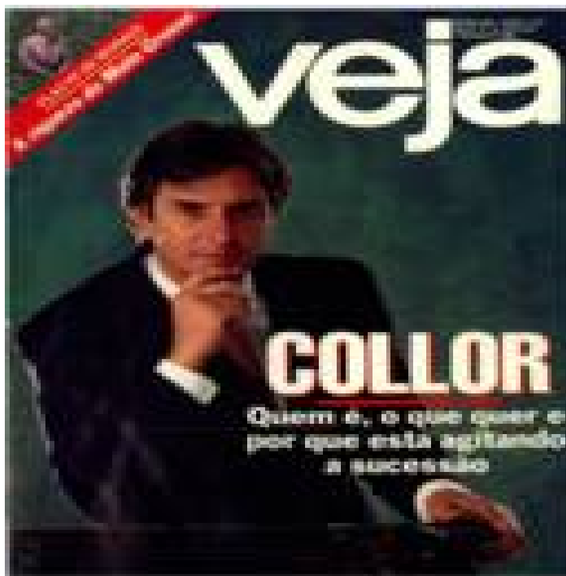
Imagem 3: Capa da Veja - Collor: quem é, o que quer