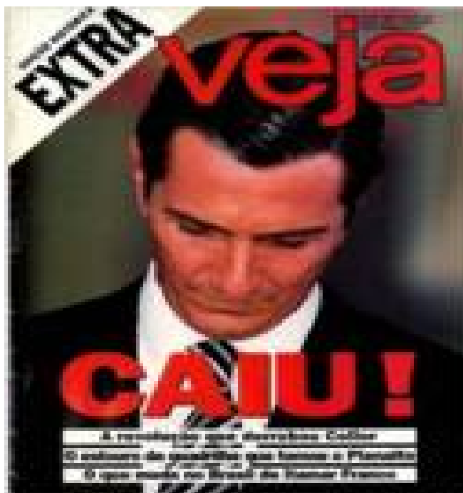
Fonte: Revista Veja , São Paulo: Editora Abril, nº 1255, 30/09/ 1992.

A capa enfatiza um Fernando Collor cabisbaixo. Diferentemente da capa anterior, ela apresenta uma definição explícita, que, escrita em caixa alta, aparece na exclamação “CAIU!” seguida de três subtítulos que demonstram perspectivas distintas e contraditórias entre si. No primeiro, o processo que derrubou Collor foi fruto de uma revolução e, portanto, efetuado pela vontade e responsabilidade do povo. A revista parece não querer correr os riscos pelo ônus de apoiar, explicitamente, outro presidente e incorrer em novos (mesmos) erros. O segundo expressa a ideia de que a queda de Collor foi em consequência as ações da quadrilha que tomou o palácio. E, sendo assim, o processo de Impeachment , constitucionalmente