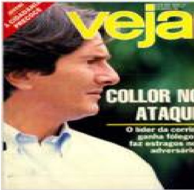
Imagem 4: Capa da Veja - Collor no ataque