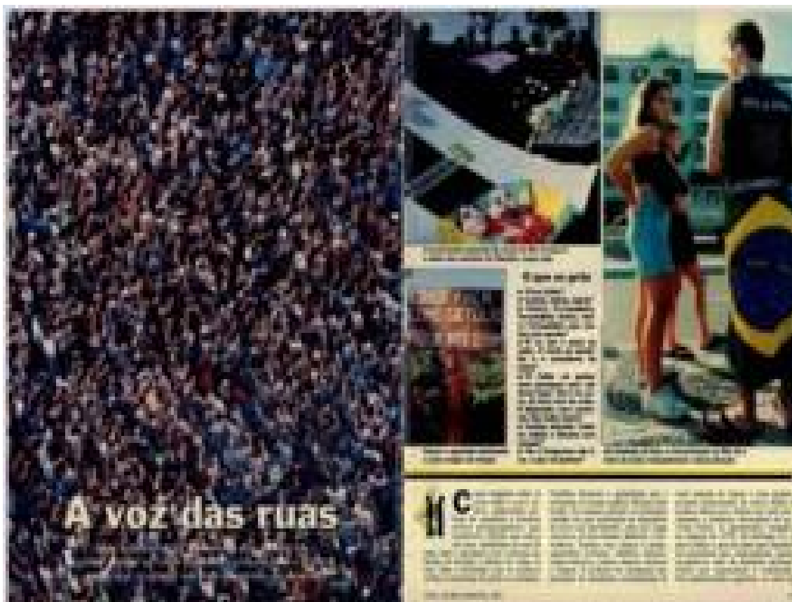
Imagem 21: Matéria de página - A voz do povo chega ao Congresso