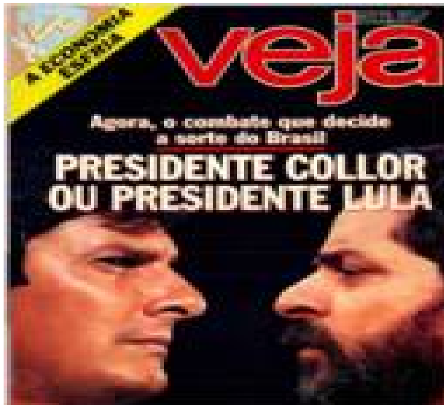
Imagem 7: Capa da Veja - Agora, o combate que decide a sorte do Brasil