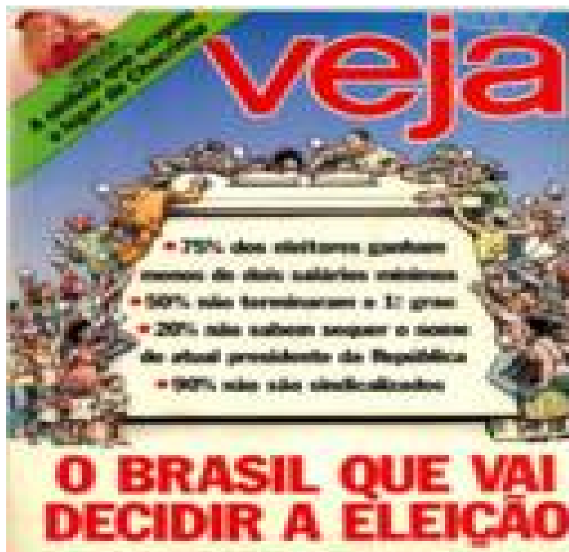
Imagem 6: Capa da Veja - O Brasil que vai decidir a eleição