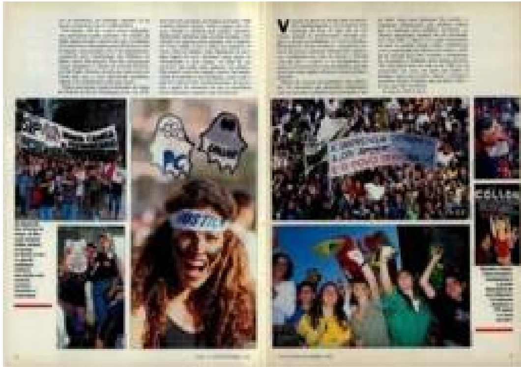
Imagem 27: Matéria de página – A vitória do povo