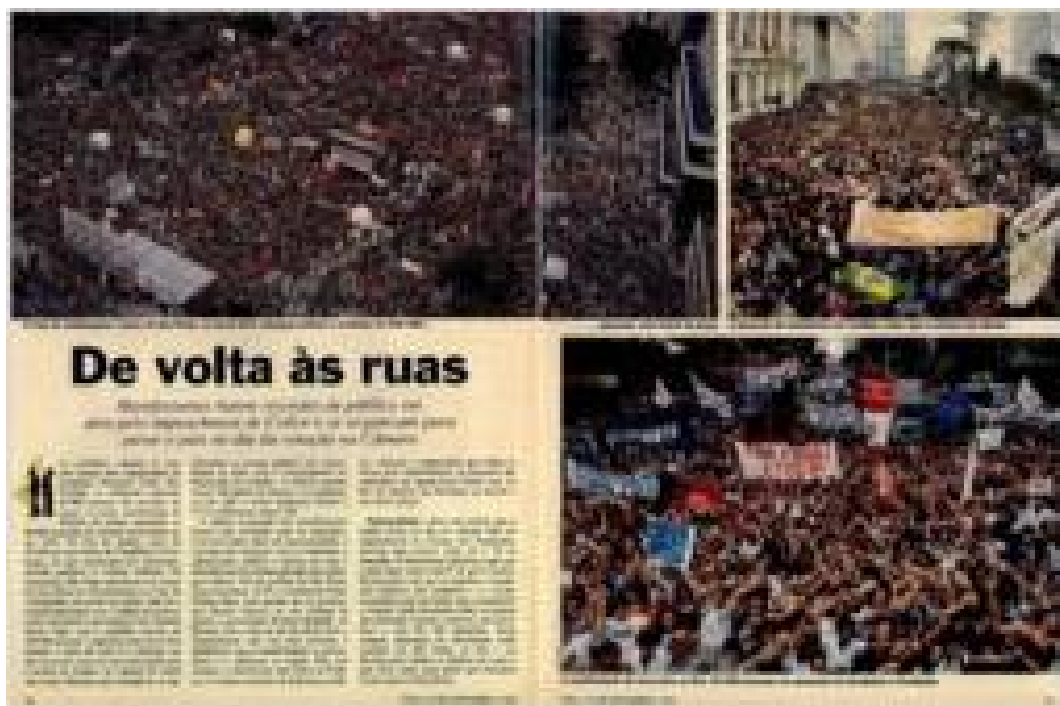
Imagem 24: Matéria de página – De volta as ruas