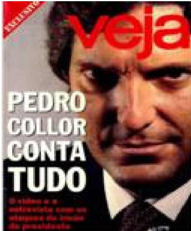
Fonte: Revista Veja , São Paulo: Editora Abril, n° 1236, 27/05/ 1992.

A partir dessa reportagem, realizada pela Veja com Pedro Collor no final do mês de maio de 1992, nenhuma edição da Veja deixou de mencionar o caso até a aprovação do pedido de Impeachment na Câmara dos Deputados, onde Collor perdeu por 441 votos. Assim, ora a revista Veja destacava a corrupção no governo, ora explicava aos seus leitores as etapas do processo de Impeachment . Era como se ela estivesse colocando a si mesma como uma espécie de juiz. Nas suas reportagens, ela não somente descrevia os fatos, mas, pela