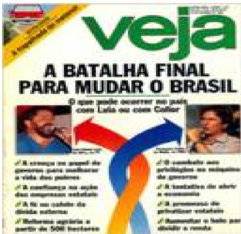
Imagem 9: Capa da Veja - A batalha final para mudar o Brasil