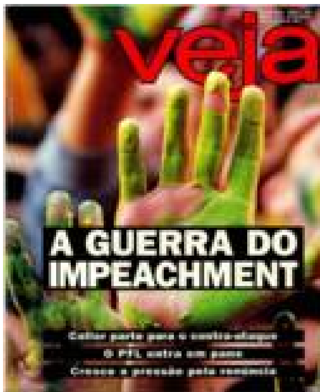
Imagem 13: Capa da Veja - A guerra do Impeachment