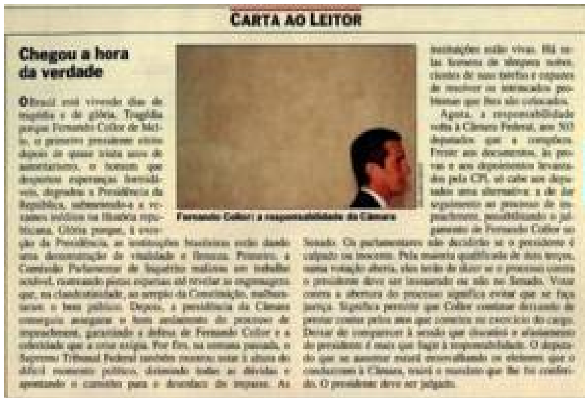
Imagem 18: Editorial - Chegou a hora da verdade