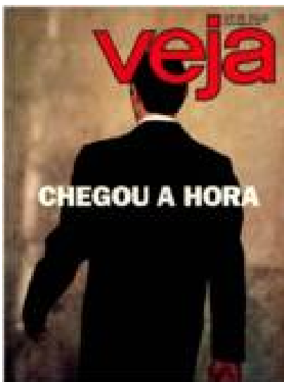
Imagem 15: Capa da Veja - Chegou a hora