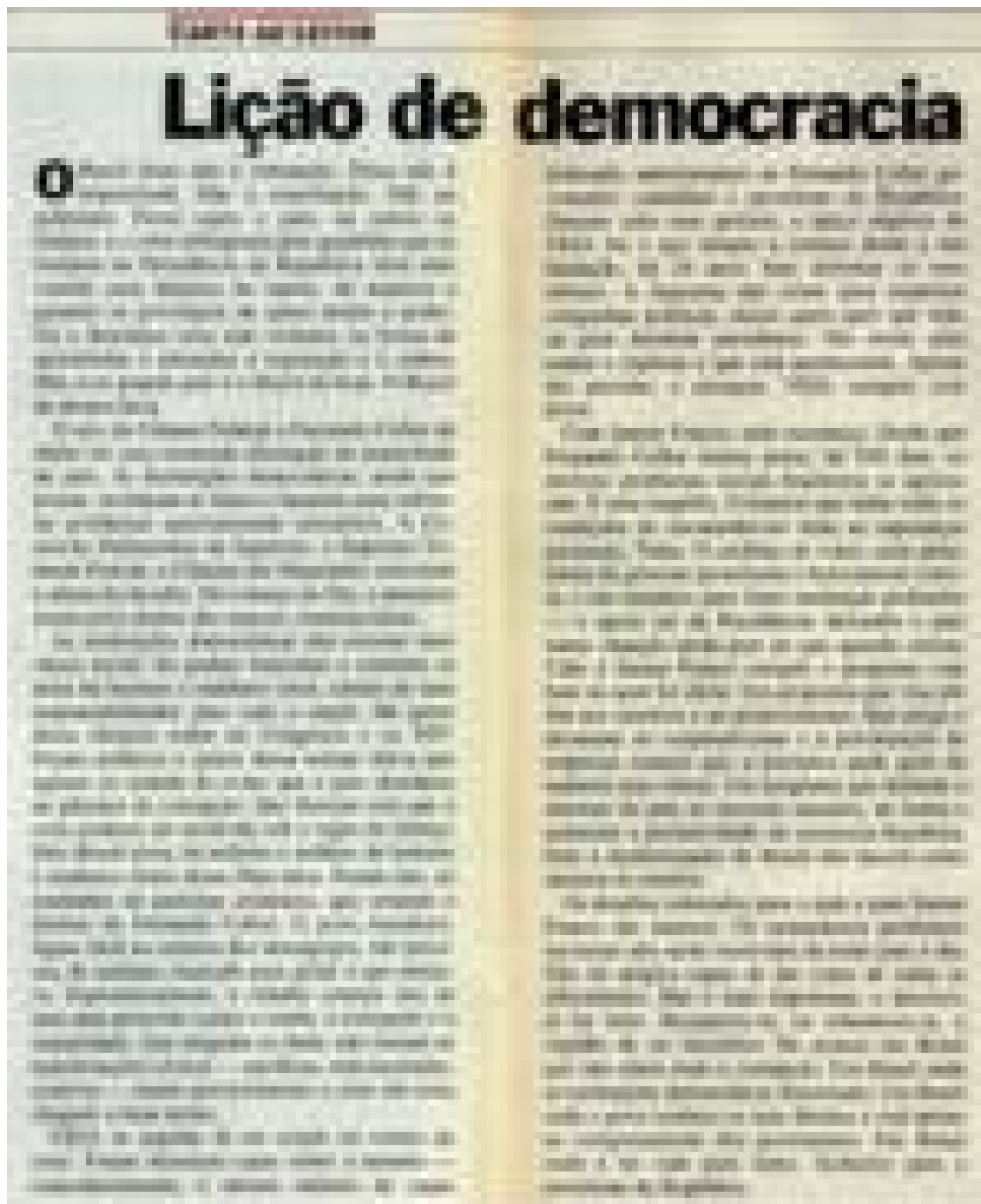
Imagem 19: Editorial - Lição de democracia