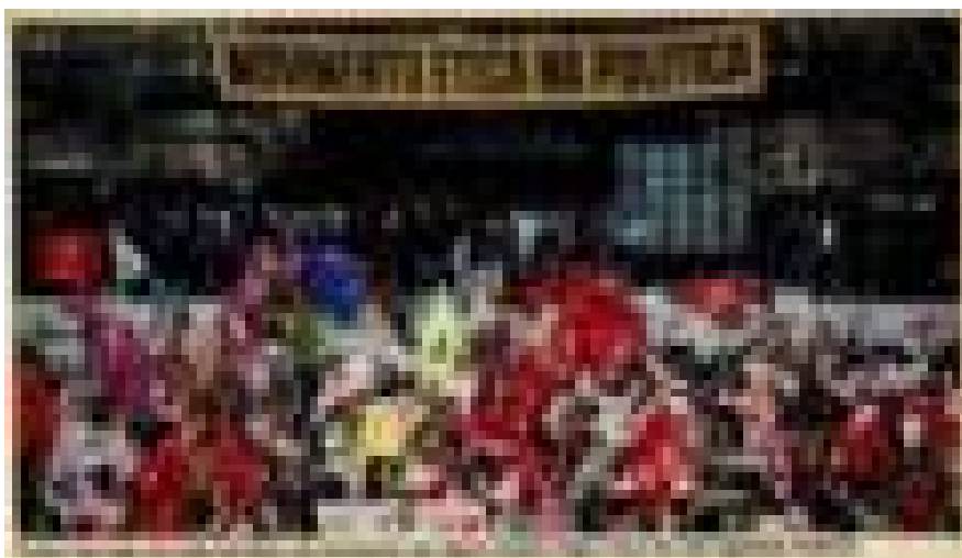
Imagem 28: Matéria de página – Nas assas da ética