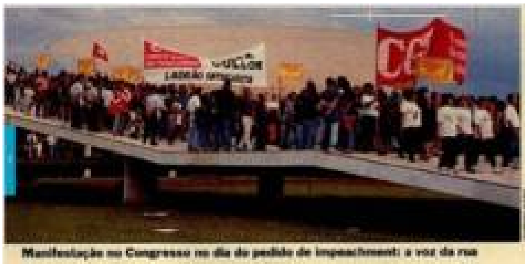
Imagem 25: Matéria de página – Na trilha do falso

Fonte Revista Veja , São Paulo, nº 1251 de 09/09/1992, p. 34