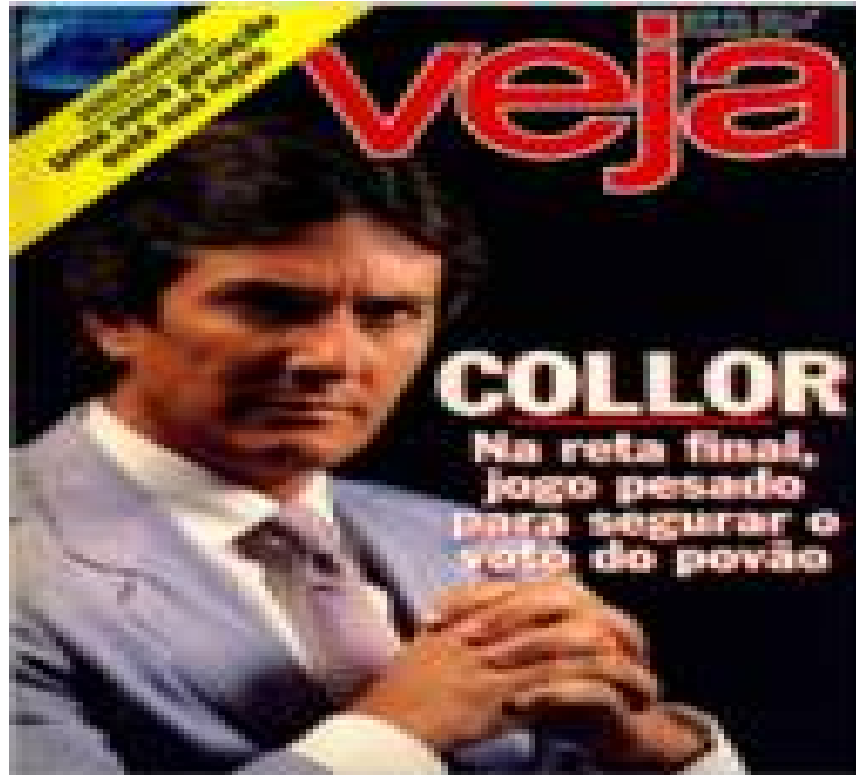
Imagem 8: Capa Veja - Collor na reta final