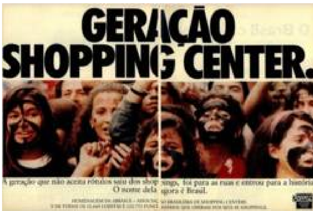
Imagem 22: Geração Shopping Center