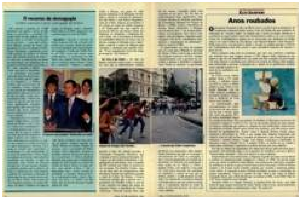
Imagem 30: Matéria de página – Alegria, alegria