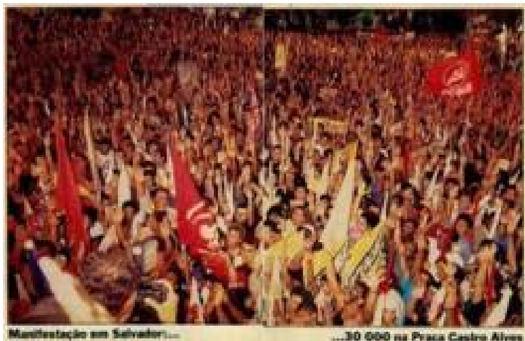
Imagem 26: Matéria de página – A epopéia de Ulysses