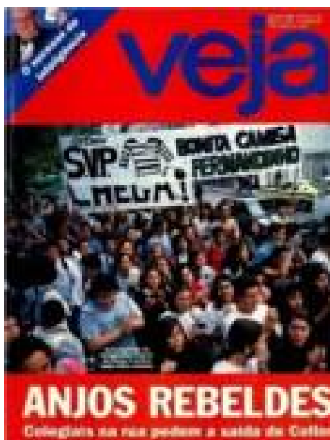
Imagem 31: Capa - Anjos rebeldes