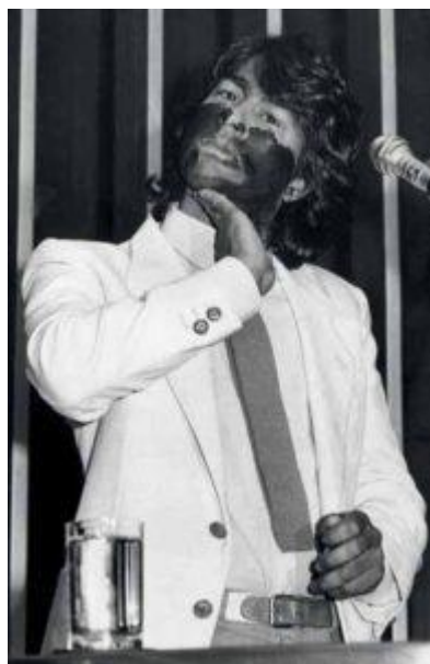
Figura 1: Ailton Krenak durante a Assembleia Nacional Constituinte em 1987

Os povos indígenas foram representados na Subcomissão dos Negros, Populações Indígenas, Pessoas Deficientes e Minorias e conseguiram apresentar suas reivindicações a cerca da sociedade multicultural brasileira e a necessidade de autorepresentação do indígena. A partir daí, foram reconhecidas as suas organizações políticas e sociais, sua cultura e sua língua. Dentre diversas falas e apresentações, Krenak pintou seu rosto de tinta preta à base de jenipapo e denunciou a campanha nacional antindígena (LOPES, 2017).