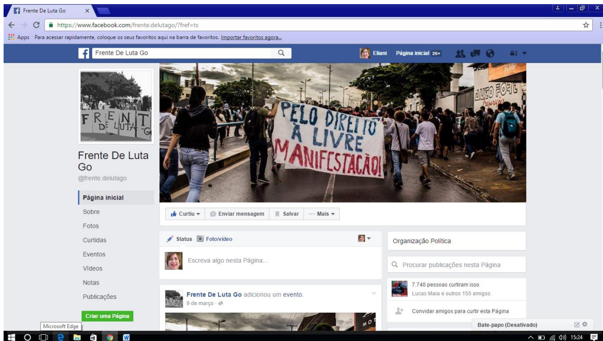
Capa da Fan Page da Organização Política Frente de Luta Go no Facebook. Print feito em 30/09/2016.