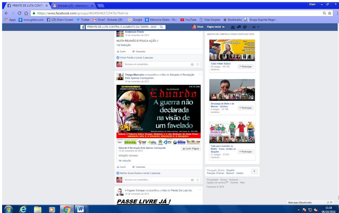
Post de ativista da Frente de Luta publicado no dia 10/03/2013, com o seguinte texto: “Muita reunião e pouca ação !:”.