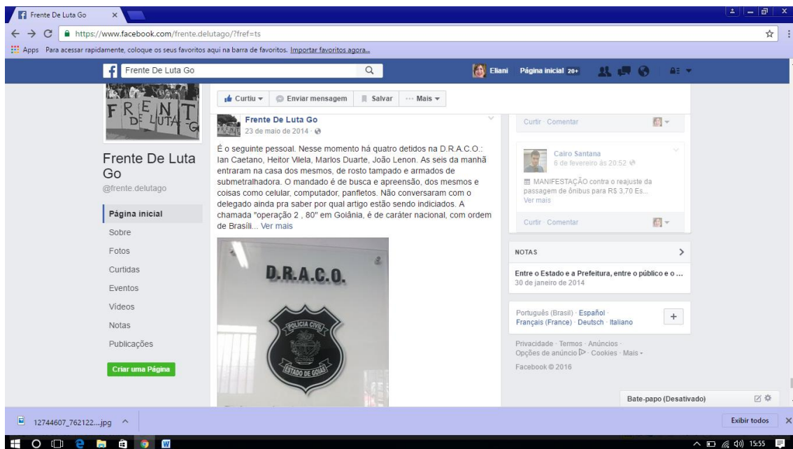
Post da Frente de Luta Go publicado no dia 23/05/2014 relatando como três dos quatro ativistas com mandado de prisão foram presos neste dia, de madrugada em Goiânia.