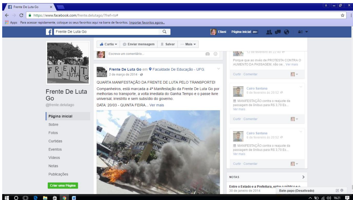
Post da Frente de Luta Go publicado no dia 02/03/2014 convidando para quarta manifestação da Frente de Luta.