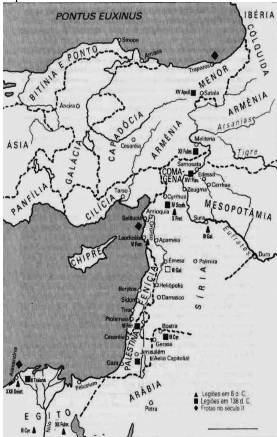
Fronteira oriental In: Petit, 1989:108