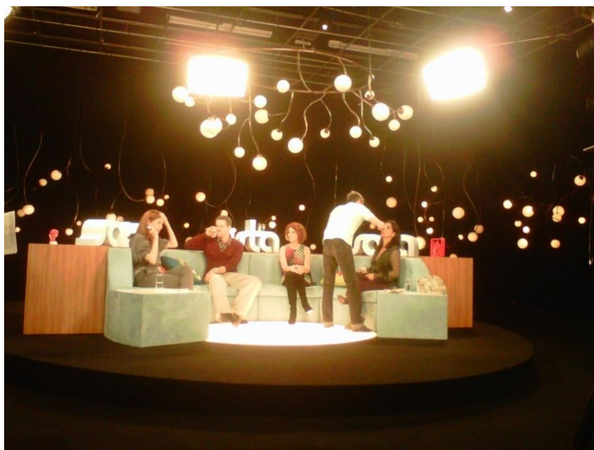
Figura 11 – Programa Saia Justa, com destaque para São Jorge ao lado direito da imagem

Essa nova faceta não passa despercebida em outras formas de midiatização. O santo agora estará presente não só nas procissões, igrejas ou nos terreiros, caminha por filmes, programas de TV, documentários e shows. Sua trajetória se misturará à trajetória do Rio, agora justaposto a um ideário do “ser carioca”. Vejamos as imagens extraídas do domínio público. Começemos pela imagem do programa televisivo, caracterizado com uma pauta de assuntos variados, apresentado na maioria das temporadas por mulheres. Desconhecemos as razões para a colocação da imagem no cenário, porém, considerando as minúcias às quais as estratégias da mídia se alicerça, ingenuidade nossa seria imaginarmos o uso desprezioso desta na configuração da cena.