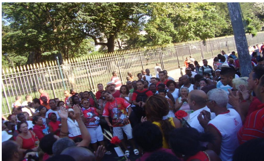
Figura 5 – Cerimonial de umbanda em louvor a Ogum na entrada principal da igreja

As inflexões dentro da nossa problemática, ao utilizarmos as ferramentas teóricas supradescritas (identidades, fluxos e fronteiras), não abarcam, de forma conclusiva, nossa problemática. Se analisarmos os grupos distintos que mantinham a crença no santo à época (de patrícios, passando a mestiços, negros e a população marginalizada de forma geral), veremos que pouco ou quase nada é coesivo, exceto a crença em São Jorge e a condição de subalternizado. Ademais, até mesmo na homenagem ritualística esses grupos divergem. Via de regra, fora da data festiva, não comungam do mesmo espaço social.