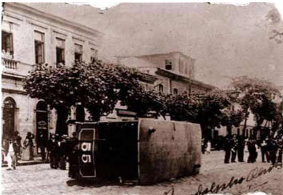
Figura 3 – Bonde tombado na Revolta da Vacina no Rio de Janeiro