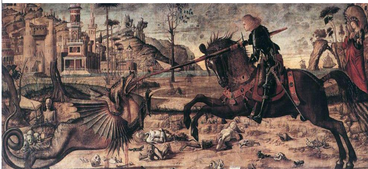
Figura 1 – São Jorge matando o dragão - 1507

De acordo com o exposto, há versões variadas para sua origem. Ademais, as histórias também são de localidades variadas, lugares que, naquele momento, politicamente, não coadunavam com os ditames da Igreja. Apesar de a discussão acerca da disputa política a qual a Igreja do Oriente (Constantinopla) e a do Ocidente (Roma) travaram a partir do século VI e que se sustentaria até o século XI, denominada Cisma Grega, não ser o objetivo principal da nossa discussão, não seria ilógico raciocinarmos que, se a fé em São Jorge tem sua origem e veneração na Igreja do Oriente, ao Ocidente não seria oportuno legitimá-la. Trata-se de um mundo dividido, com São Jorge como “guardião da fronteira”, como retrata o artista veneziano Vittore Carpaccio, na tela São Jorge matando o dragão , reproduzida a seguir: