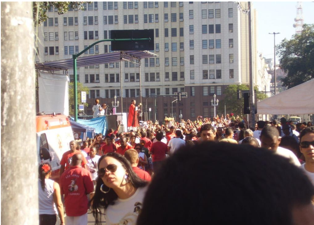
Figura 8 – Missa campal da Igreja Católica à esquerda do local das homenagens de umbanda

não encontrariam razão ou afinidade para reunião ou manutenção de laços identitários. Porque, em questões identitárias, seremos o “outro” de “alguém”. A vida urbana, como já citamos, é um acelerador e o grande bioma dessas questões. A cidade potencializa esses encontros e, conforme descrevemos nosso objeto, sua natureza é essencialmente urbana. No mito criador, São Jorge defende as cidadelas dos dragões, Veneza do Islã, Portugal dos castelhanos, o Império brasileiro de seus “inimigos” e os cariocas dos seus mais variados “dragões”.