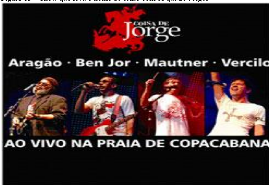
Figura 13 – Show que leva o nome do santo com os quatro Jorges