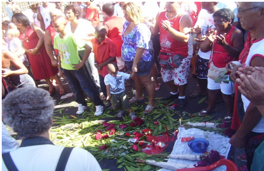
Figura 7 – As oferendas a Ogum