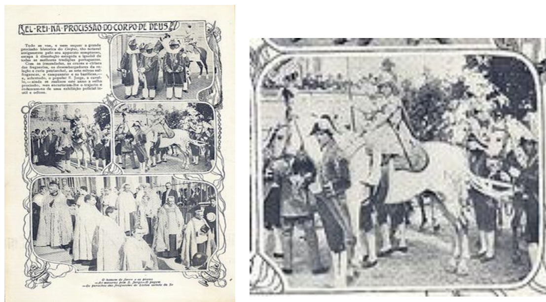
Figura 4 – Procissão em homenagem ao Santo, com a participação do rei de Portugal