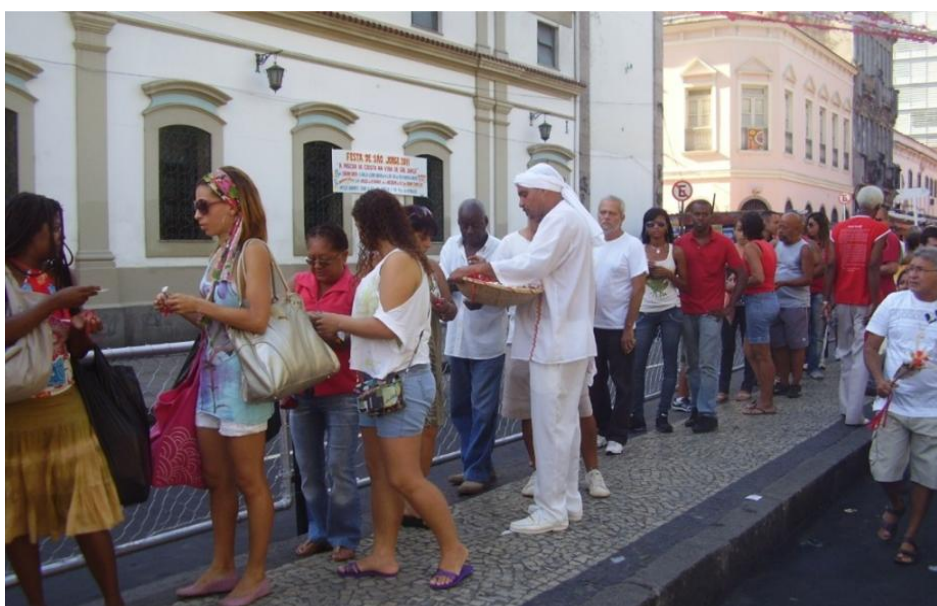
Figura 6 – Devotos aguardam na entrada da igreja enquanto uma pessoa em trajes típicos da umbanda oferta santinhos, guias e orações a São Jorge

O que constatamos é que o corte promovido pela “destituição” do santo no alvorecer da República brasileira produziu todo esse turbilhão de fluxos e refluxos que hoje percebemos na crença em São Jorge, em especial, no Rio de Janeiro, cada qual a sua maneira. Nas comemorações em homenagem ao santo que participamos, como parte da pesquisa de campo, São Jorge apresenta-se como protetor das seguintes categorias sociais: jornalistas, policiais, militares do Exército, bombeiros militares.