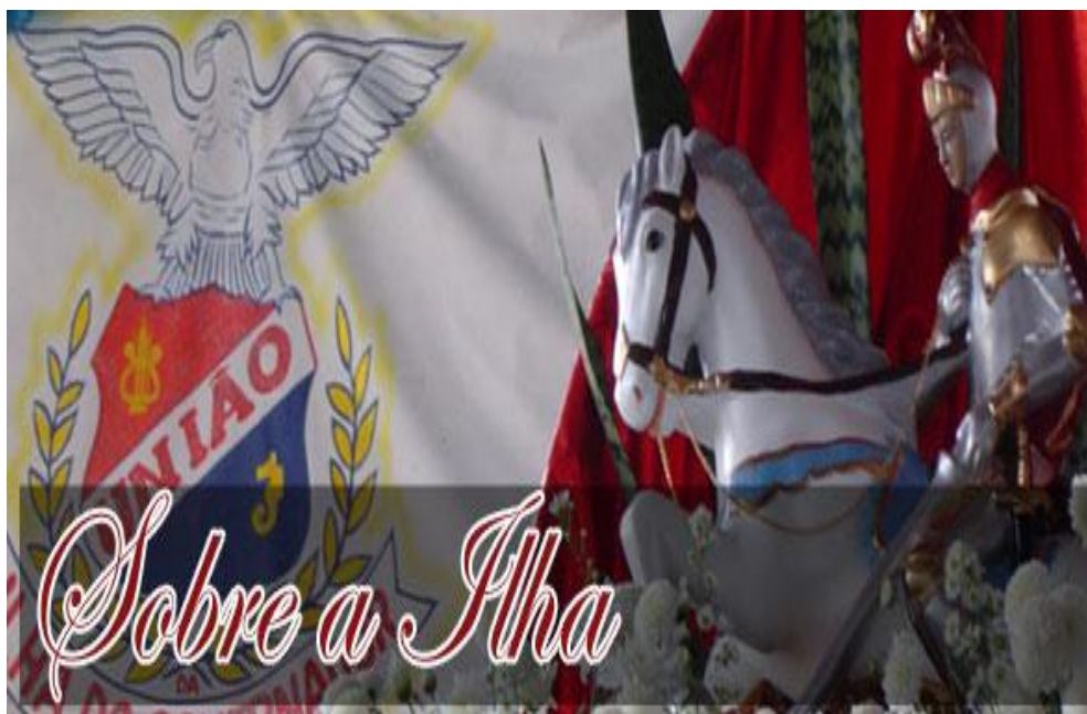
Figura 9 – Imagem do site da Escola de Samba União da Ilha do Governador