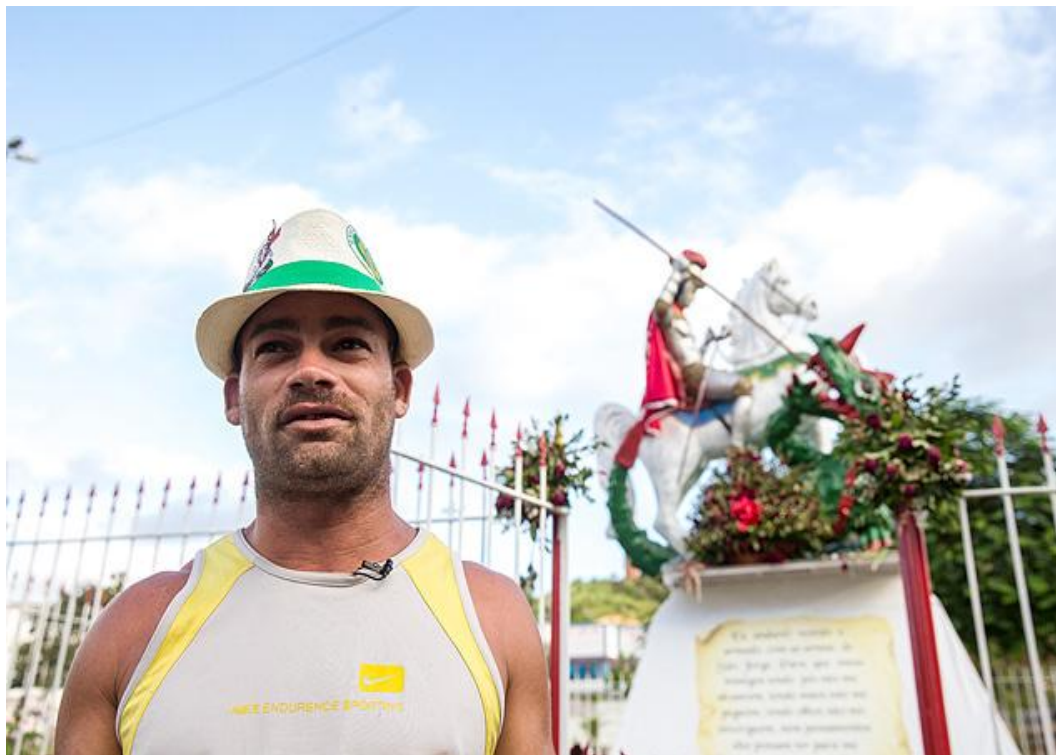
Figura 10 – Sentinela da estátua de São Jorge na zona oeste do Rio de Janeiro

alguém para cuidar da estátua do santo. Foi contratado por um salário-mínimo e mais R$ 200 em vale-refeição. (Folha Uol, 2015).